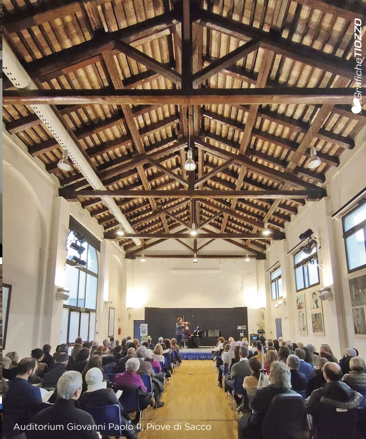
Auditorium Giovanni Paolo II, Piove di Sacco