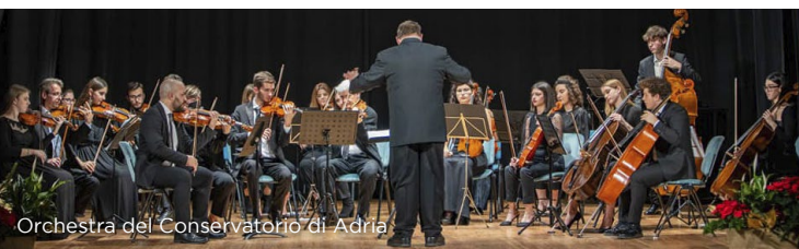
Orchestra del Conservatorio di Adria