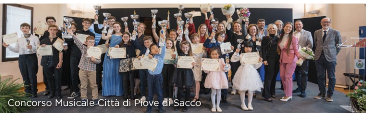
Concorso Musicale-Città di Piove di Sacco